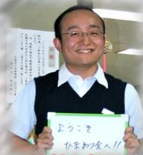
入社3年目 職種：事務員

新人研修に始まり、法人内での勉強会。勤続年数や役職に応じた研修なども行われています。外部での研修や勉強会への参加も積極的です!!