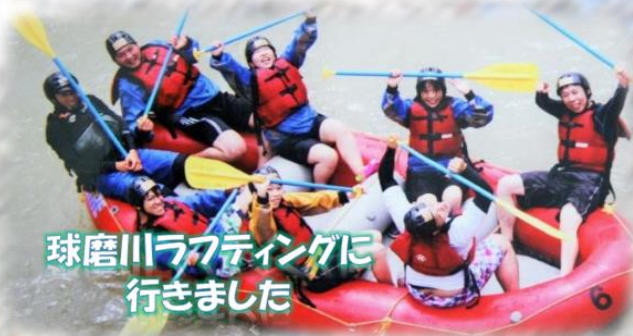
球磨川ラフティングに 行きました

次のシフトを組む際に希望日に 休みを入れることができるので、 仲の良いスタッフと長年やって みたかったラフティングに行く ことが出来ました。 休日をうまく使いプライベートも 充実して過ごせるので仕事にも 集中することが出来ます。