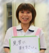
入社8年目 職種：介護士