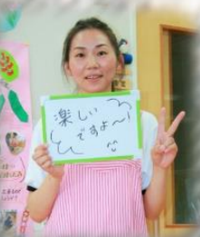
入社2年目 職種：介護士