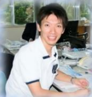
入社3年目 職種：相談員

老健や特養でもチームアプローチは当然。1つの目標に向かって他職種と連携することでチームワークも良くなり、職員間の絆も深まります!!