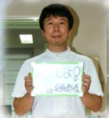
入社10年目 職種：理学療法士

ライフワークバランスを取り入れ、仕事だけでなくプライベートも充実することで より良い仕事が出来ると法人では考えています!!