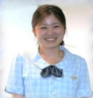
入社3年目 職種：事務員