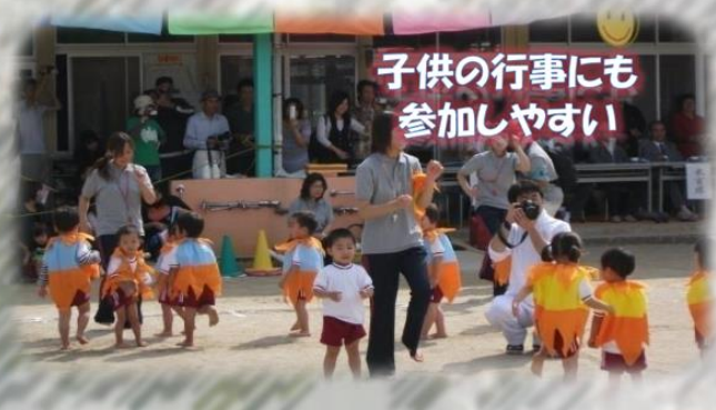
子供の行事にも 参加しやすい

小さい子供もいるのでシフトを 組む際に配慮してもらったり、 子供の行事に参加しやすいように シフトを組んでもらったり しています。 また子供の急な発熱や病気等で お休みをいただけるので助かって います。