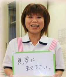
入社8年目 職種：介護士