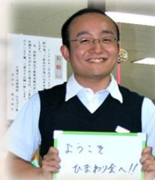
入社3年目 職種：事務員

ひまわり会では新人職員に対して新人研修が行われており、挨拶・身だしなみなど社会人としての基礎を学ぶことができます。またその他にも外部研修にも積極的に参加させて頂き自分自身のスキルアップにも繋がっています。