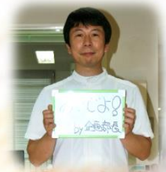
入社10年目 職種：理学療法士