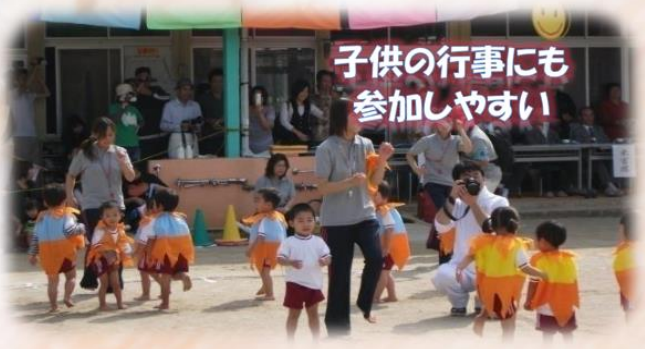
子供の行事にも 参加しやすい

小さい子供もいるのでシフトを 組む際に配慮してもらったり、 子供の行事に参加しやすいように シフトを組んでもらったり しています。 また子供の急な発熱や病気等 お休みをいただけるので助かって います。