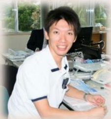
入社3年目 職種：相談員