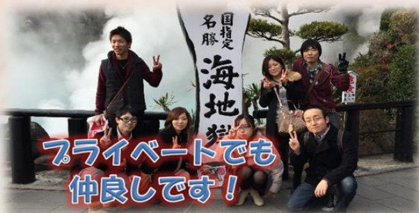
プライベートでも仲良しです！

入社して右も左もわからなかった私に優しく一から丁寧に仕事を教えて頂きました。仕事以外でも先輩と食事に行ったり、同期と遊びに行ったりなど人間関係が広まりました。ひまわり会は職場結婚する人も多く職員同士の仲が良いのは魅力の1つです。