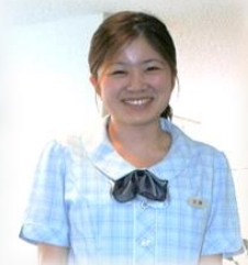
入社3年目 職種：事務員