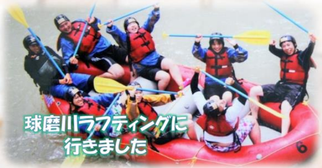
球磨川ラフティングに 行きました

次のシフトを組む際に希望日に 休みを入れることができるので、 仲の良いスタッフと長年やって みたかったラフティングに行く ことが出来ました。 休日をうまく使いプライベートも 充実して過ごせるので仕事にも 集中することが出来ます。