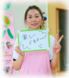
入社2年目 職種：介護士